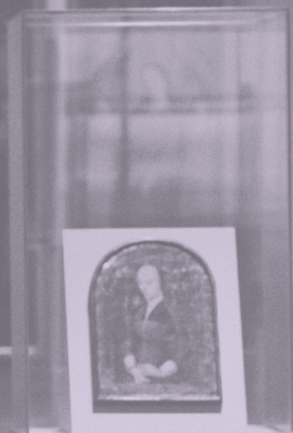
Portrait of a man in a dark suit, seated, displayed in a glass case. The portrait is set within a white frame with a dark, arched top. The glass case is mounted on a light-colored pedestal.