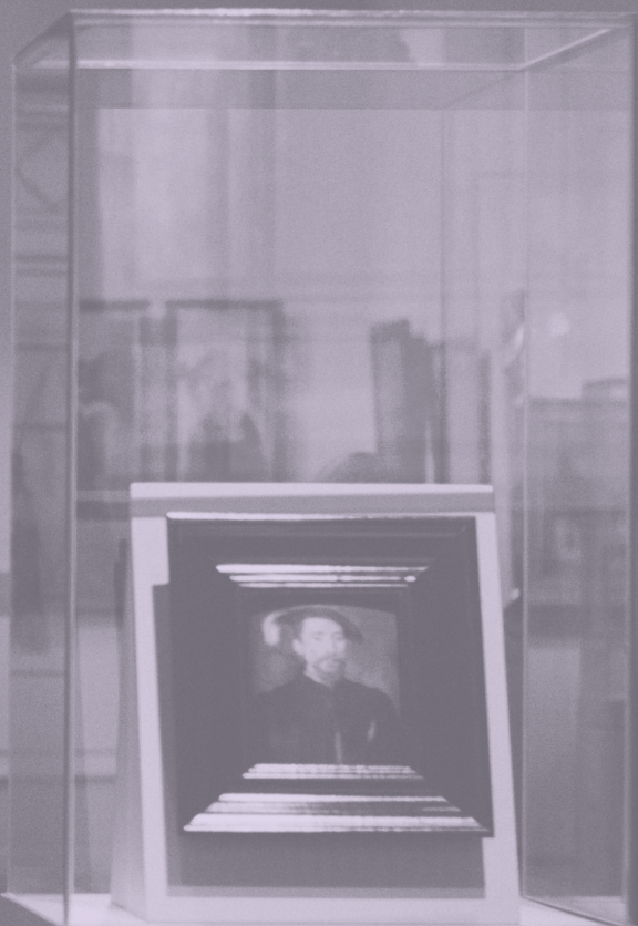
Portrait of a man in a dark suit, seated, displayed in a glass case. The portrait is set within a white frame with a dark, arched top. The glass case is mounted on a light-colored pedestal.